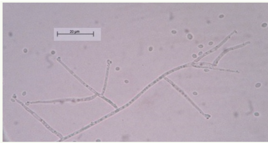
Figura 1. Akanthomyces . Aislado D-AI1460 a 400x.

Se obtuvieron 14 aislados cultivados en el medio de PDA, presentaron colonias blancas con fina estructura algodonosa y de un color amarillo claro por el reverso a los 10 días. las colonias de los aislados de las tres localidades, mantuvieron la apariencia algodonosa de color blanco, y aproximadamente al tercer día se observó una elevación umbonada en el centro de la colonia, se observó más sumergida y con ligeras estrías o radiaciones, las cuales son más visibles por el reverso, el cual se torna de color crema. Estos resultados coinciden con lo planteado por Brady (1979) quien encontró que Akanthomyces (= Lecanicillium ) lecanii , forma colonias en PDA con coloración blanca y crema en su reverso, además de poseer textura algodonosa. Las conidias presentaron formas elípticas-cilíndricas. Presentó hifas hialinas (Figura 1), con fiálides en grupos de tres (Zare y Gams, 2001). Las conidias fueron de elipsoidales a cilíndricas, emergiendo en el extremo superior de la fiálide. La dimensión de las conidias así como la identificación de cada aislado se presenta en el Cuadro 1.