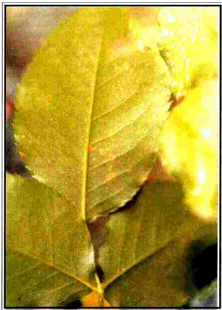
FIGURA 1 PÚSTULAS ANARANJADAS DE LA ROYA DE LA ROSA, Phragmidium sp., EN EL ENVÉS DE FOLIOLOS