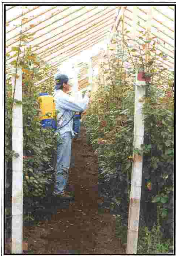
FIGURA 2 PLANTAS DE ROSAS CULTIVADAS BAJO TECHO, AFECTADAS POR LA ROYA Phragmidium sp.