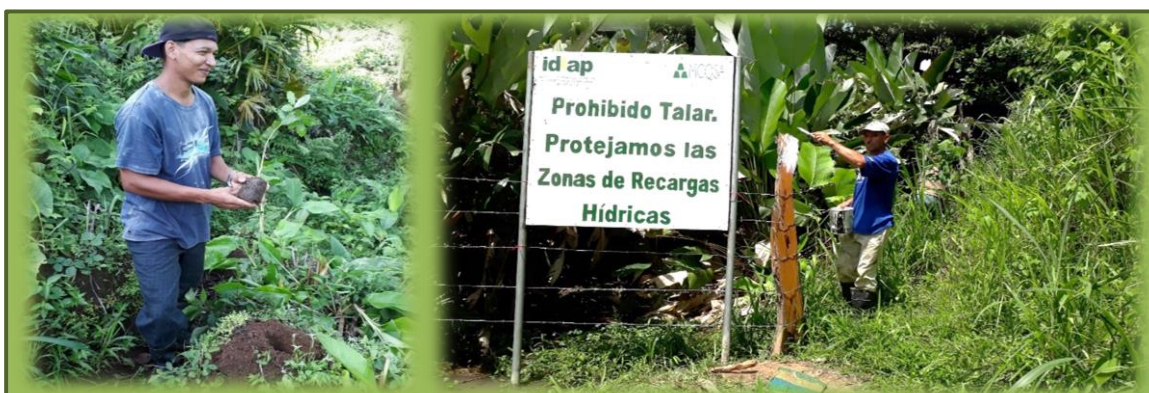
Figura 2. Identificación y ubicación, prácticas de conservación y delimitación de las fuentes de agua, con potencial de recarga hídrica.