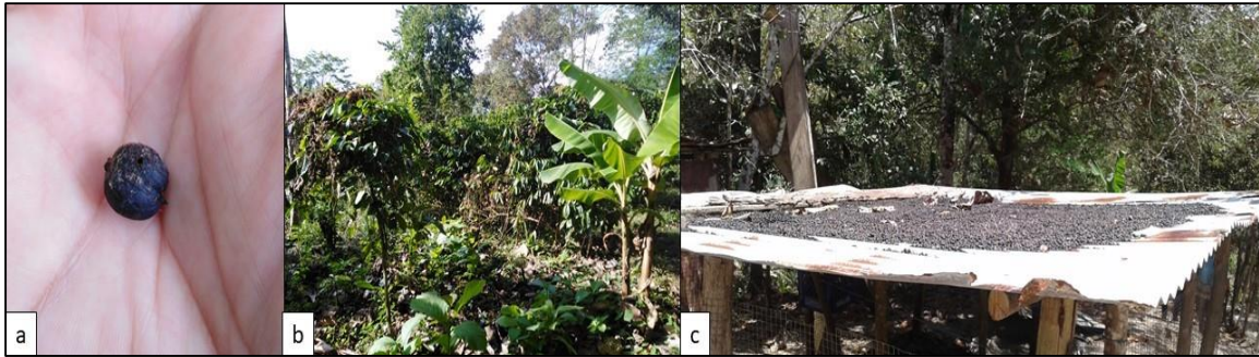
Figura 3. Limitantes de manejo en el cultivo de café en Colón: a) Granos brocados de la campaña anterior que no fueron eliminados de la planta; b) Plantas de café sin poda ni limpieza de campo adecuadas; c) Secado de granos al sol.