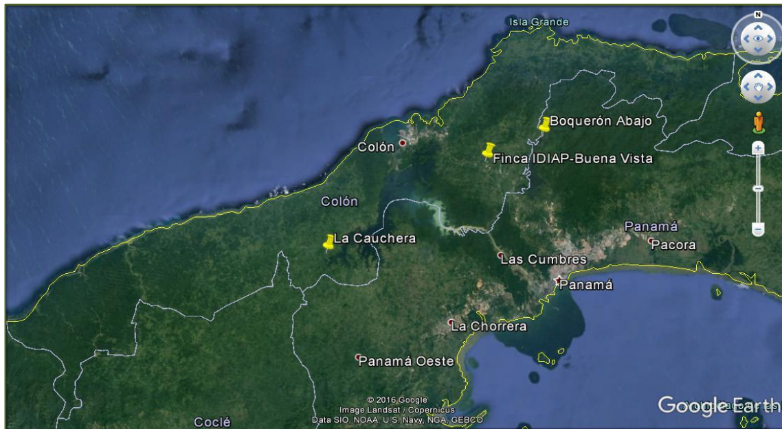
Figura 1. Localidades de estudio en Colón.

Para el estudio preliminar de la detección temprana de la broca del café, se realizó un reconocimiento de campo, para escoger el área de estudio, que correspondió a tres localidades con cultivos de café robusta ( Coffea canephora ), en la provincia de Colón, República de Panamá: La Cauchera (UTM: 17 P 600109, 1000749), Buena Vista (UTM: 17 P 642911, 1026510) y Boquerón Abajo (UTM: 17 P 658188, 1033713) (Figura 1). El estudio inició el 24 de enero de 2017 y culminó el 24 de junio de 2019; periodo durante el cual, se realizaron un total de 75 giras de campo.